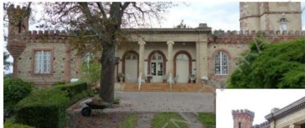
La Villa Maria (ancien château ?)