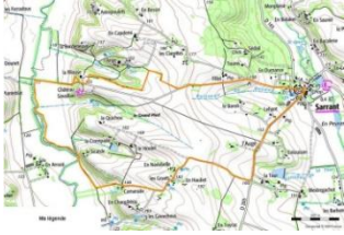
Sentier des pigeonniers.