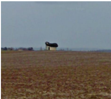
Moulin à vent de la ferme Augé.