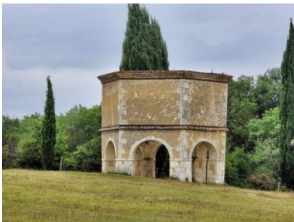
Pigeonnier du château de Savailan.