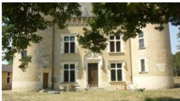
Château de Sédail : vue actuelle et carte postale

1. Le château de Savailhan du 15e siècle situé au lieu-dit La Pilouse à 2 km à l'ouest du village. Appartient à la famille de Mauléon, Denis de Mauléon étant un fidèle compagnon d'armes et ami d'Henri de Navarre.