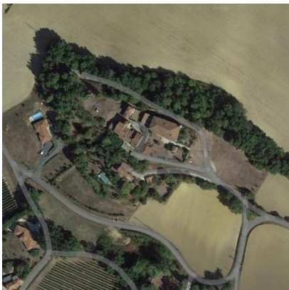
Village de Pouy-Petit

Le village comporte principalement les monuments suivants :