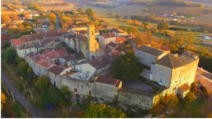
Village de Saint-Orens