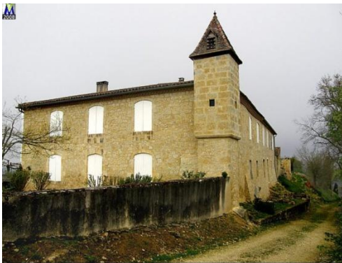
ST-ORENS-POUY-PETIT le château de Pouy-Petit

Château du 13e siècle situé au village de Pouy-Petit. Possédait une tour à chaque angle lors de sa construction. Aujourd'hui, il ne reste qu'une seule tour. Propriété privée. En passant par la porte fortifiée, vestige de remparts, rejoignez l'église.