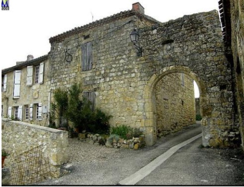
it-ORENS-POUY-PETIT la porte de Pouy-Petit

(cf https://www.saintorens-pouypetit.fr/patrimoine/ )