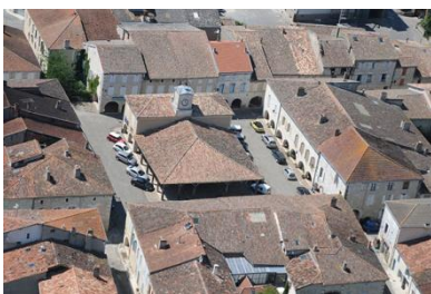
La place de la mairie.