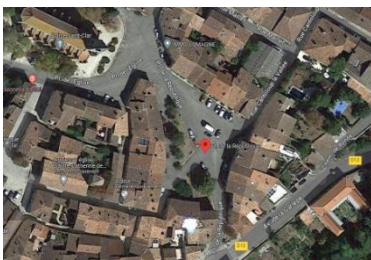
La place de la République.