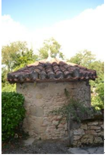
Puits parcelle AB 36 (angle rue des Lices et Grand-rue)