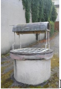
Puits (rue des Lices du Nord, non cadastré), vue depuis le nord.

* du côté nord-ouest du village, visible également en suivant le chemin de ronde. (cf https://fr.wikipedia.org/wiki/Puycasquier et https://inventaire.patrimoines.laregion.fr/dossier/IA32100110 )