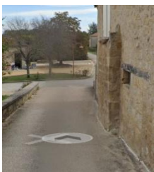
Porte au sud (vestige du passage avec massif en pierre sur le côté).