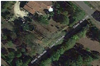
Tour au nord-ouest.

Enceinte collective du 13 e siècle enfermant totalement le castelnau sur les côtés nord, ouest et sud, l'est étant clôturé par l'ensemble château-église, lui-même fortifié.