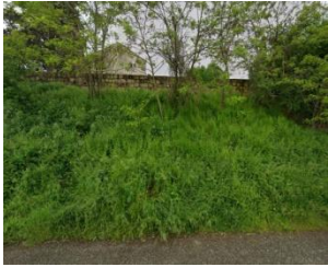
Murs au nord-est.