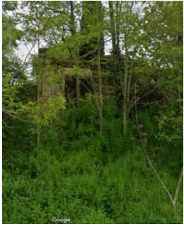
Contrefort au nord.