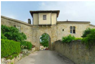
Tour-porte au nord.