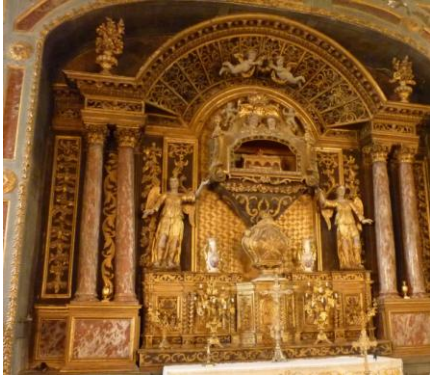
Eglise Saint-Hilaire (autel et retable-reliquaire)

Située au nord du village, l'église est du 14 e siècle et constituait un poste de défense. L'église est un édifice à nef unique de plan allongé et à chevet plat. Le mur nord est étayé de cinq gros contreforts. Le clocher-mur est particulier en forme de beffroi avec deux cloches et des ouvertures ménagées à son sommet sur les quatre faces pour assurer la surveillance. Le porche, qui est aussi l'une des deux portes du village, est couvert d'un auvent reposant sur 3 colonnes. La porte d'entrée percée dans la façade occidentale a été reconstruit au 19 e siècle et présente un décor sculpté à tête humaine et feuillages sur les chapiteaux.