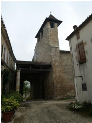
Eglise Saint-Hilaire (clocher-mur)