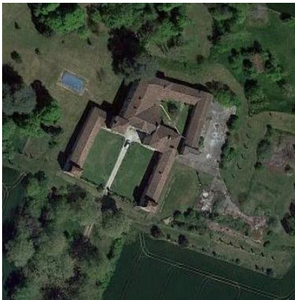
Château de Campaigno (vue aérienne)

Château du 18 e siècle, situé à 2 km au nord-ouest du village près de la départementale 112, le château est accessible par une allée de chênes et de marronniers qui aboutit à une clôture dont le portail en fer forgé s'ouvre entre deux piliers maçonnés. La cour d'honneur est délimitée de part et d'autre par des communs en rez-de-chaussée s'appuyant sur deux tours carrées à toiture en pavillon. Ces tours situées au sud sont occupées par deux pigeonniers à l'étage supérieur. L'articulation du logis principal et des communs en L se fait par l'intermédiaire de deux pavillons quadrangulaires qui flanquent la façade méridionale. La façade principale compte cinq travées réparties sur deux niveaux surmontés d'un fronton triangulaire. La façade ouest, compte huit travées ouvertes par de grandes fenêtres et la façade nord-ouest présente quatre travées de fenêtres dont les deux du rez-de-chaussée, à l'angle nord-ouest, marquent l'emplacement du chai. Les communs à un seul niveau s'appuient à l'est des bâtiments principaux et délimitent une cour secondaire. Ils offrent au nord un