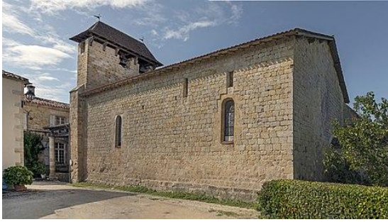
Eglise Saint-Hilaire (vue d'ensemble)