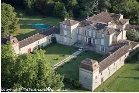
Château de Campaigno (vue d'ensemble)