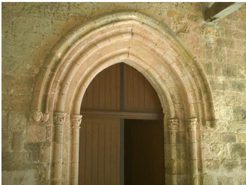
Eglise Saint-Hilaire (porte d'entrée sous le porche)