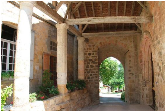
Eglise Saint-Hilaire (porche)