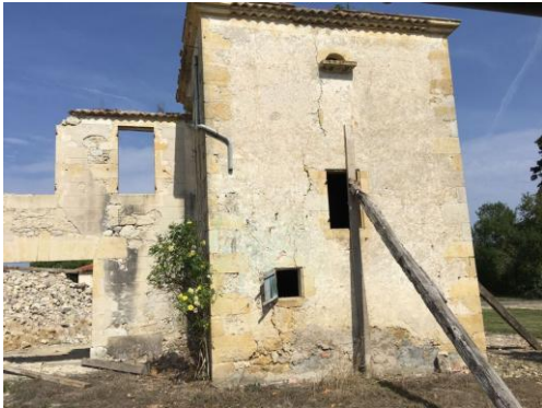
Pigeonnier avant restauration.

Pigeonnier situé au coeur du village et faisant partie d'une vieille ferme en ruine dite "Maison Lenglet". Pigeonnier-tour de forme carrée (5x5 m au sol) accolé à l'habitation. Présence de deux trous d'envol de forme arrondie (un, côté Sud, a été bouché et un, côté Est, précédé de tables d'envol en pierres). Ils mesurent environ 10cm afin d'interdire l'entrée à tout oiseau au corps plus imposant qui pouvait s'attaquer aux œufs ou aux pigeonneaux. Le pigeonnier et son habitation accolée ont été restaurés en 2020 pour devenir une salle des fêtes polyvalente.