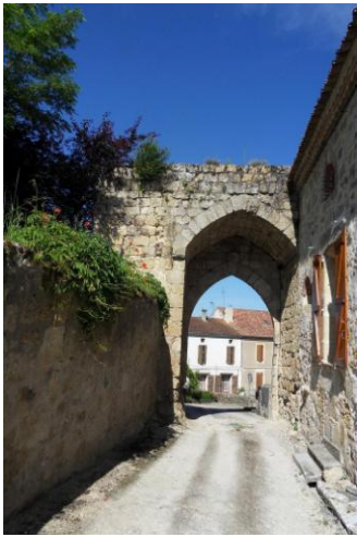
Porte en arc brisé

Du village fortifié subsiste des vestiges de remparts visible sur la partie occidentale du village avec une porte en arc brisé (arc en deux segments identiques se recoupant au sommet), deux portes (l'une au nord servant de porche à l'église, l'autre à l'ouest faisant la jonction entre le château et le village), et des restes de murs médiévaux provenant du château médiéval (1308) remplacé ensuite par une chartreuse en 1780. L'église, située près de la porte nord, participe du système défensif.