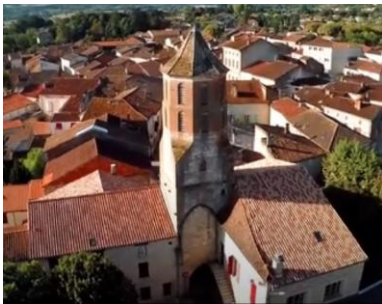
Tour de l'église Saint-Sernin