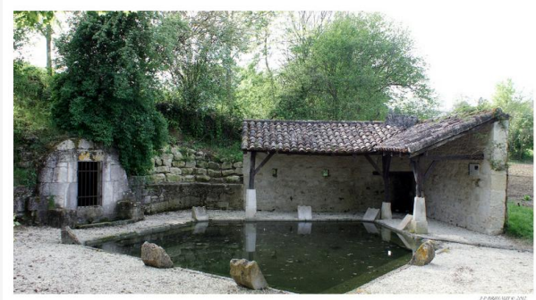
Lavoir de Labat (boulevard du Levant, chemin sur la gauche après 300 mètres de descente)