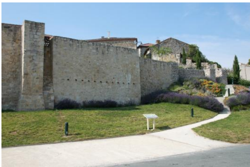
Remparts (partie ouest)