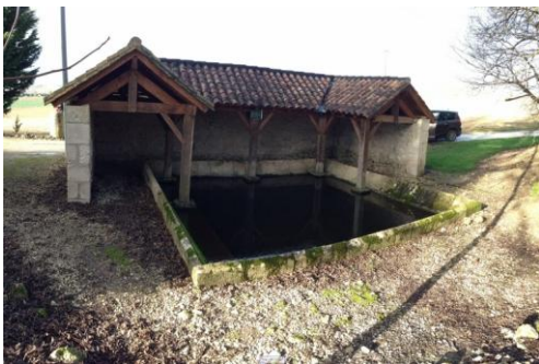
Lavoir de Lamothe (à 1 km au nord du village, à 200 mètres de la départementale 931, prendre à droite un chemin en calcine)