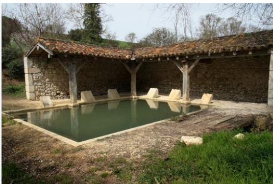
Lavoir du Tournon (boulevard du levant, au bout du chemin de la Clémentiade)