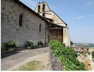
L'église avec son clocher-mur et son porche.