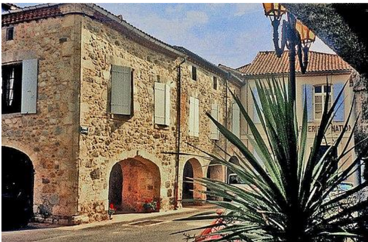
Place à cornières