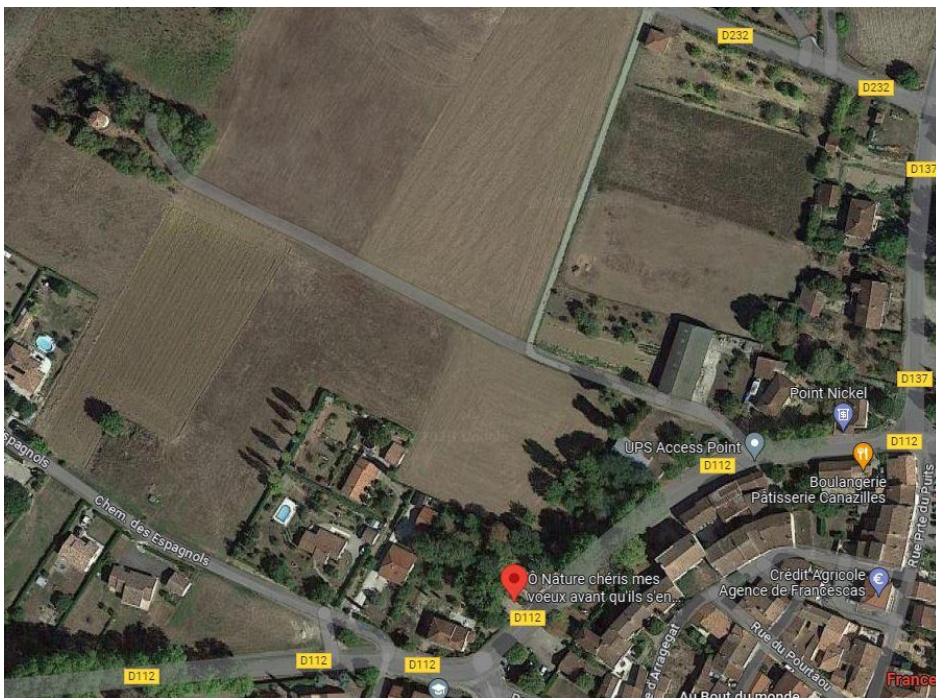
Moulin de Viaumont (au coin en haut à gauche, cf Google Maps)

Moulin à vent du 16 e siècle, situé à 300 m au nord-ouest du village, sur une motte, au bout d'un chemin. Moulin de type tour, avec mécanismes et meules aux niveaux supérieurs datant du 18 ème siècle et l'habitation en rez-de-chaussée. Meules déposées et toiture refaite. L'activité a cessé vers 1920-1925.