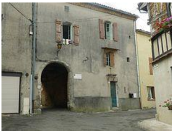
Porte du Hourrat.

Le village est entouré de remparts au 11 e siècle. Un pont-levis aurait existé rue Lapeyrade et fut détruit en 1700. Vestiges de remparts sur les fronts sud et est de l'enceinte. Depuis la place de la Mairie ?, prendre la rue du Couvent, longer la vieille église et l'ancien couvent, découvrir les remparts épais de 1m40.