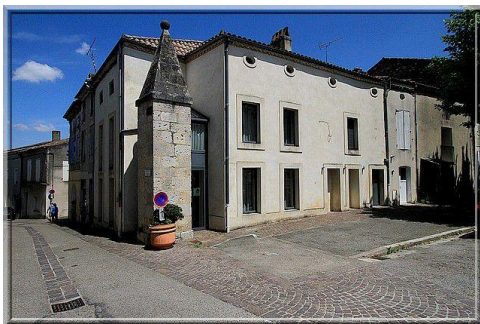
Porte de Corné